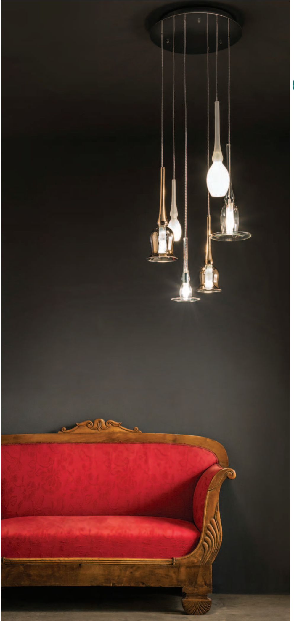
Lumiera XL X6 Bucaneve