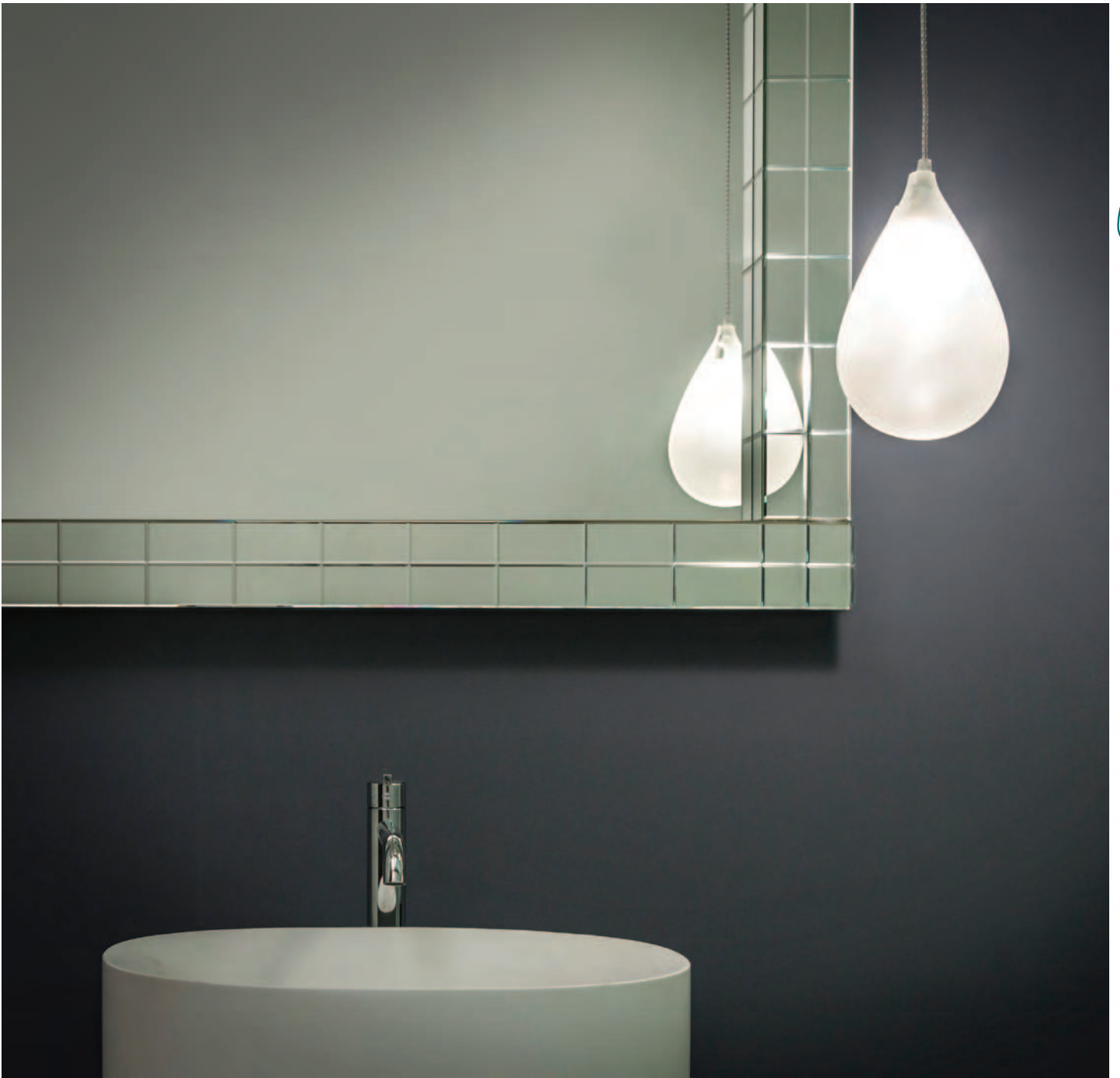
Mini XL + Goccia XL