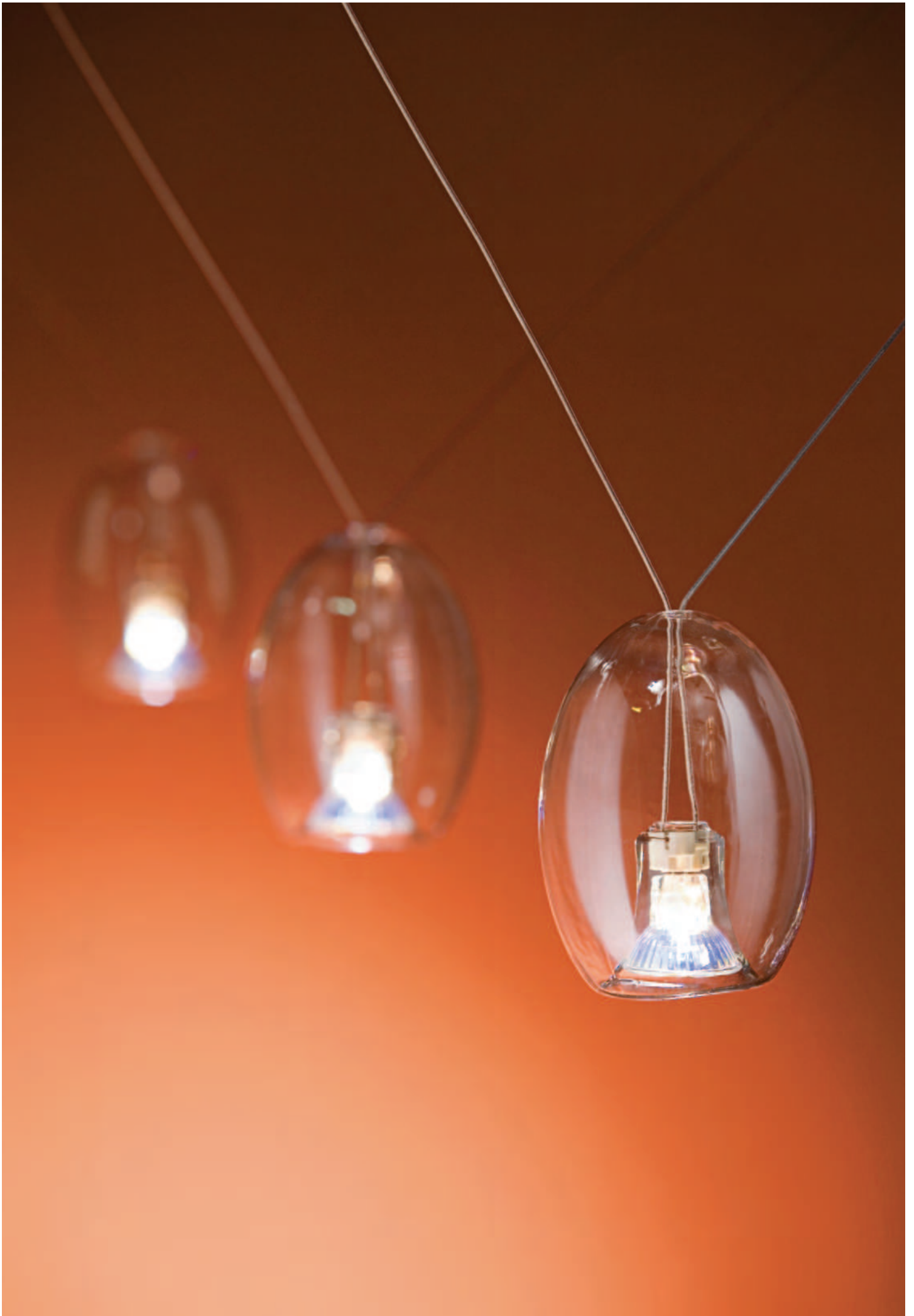
LAMPADINE LED 12V